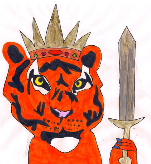
巴洛馬·凡隆羅特製

請常上 悉達多本願佛學會網站 查看仁波切的消息，以及世界各地悉達多本願佛學會的最新資訊